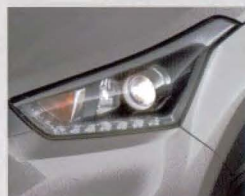
Faróis com projetor, luz diurna (DRL) de LED e Cornering Lamp.