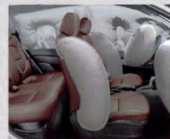
Seis airbags, controle de estabilidade e assistente de partida em rampa.