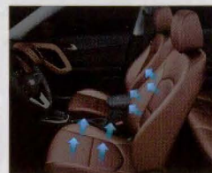
Bancos de couro e com ventilação (motorista).