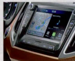
blueNav® – Central multimídia touch screen de 7" com GPS, Apple CarPlay® e Google Android Auto.