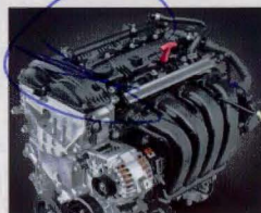
Motor Nu 2.0 Flex de 166 cv com sistema Stop & Go.